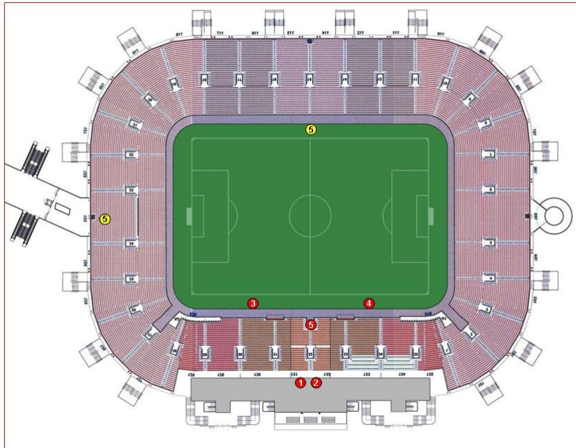
Schema 5 cam