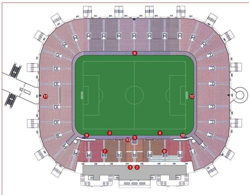
Schema 13 cam