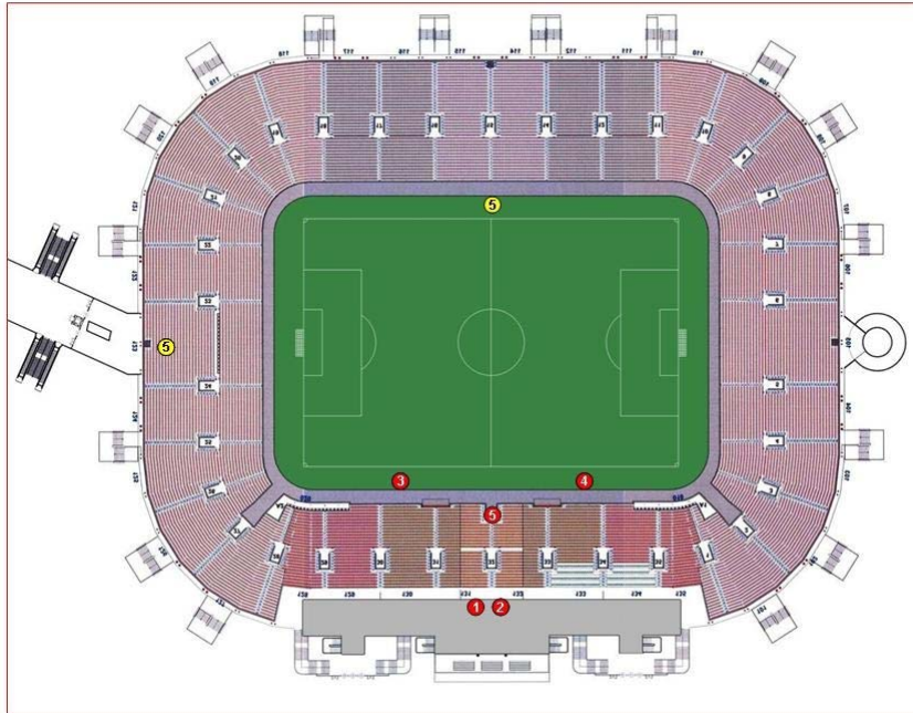
Schema 5 cam